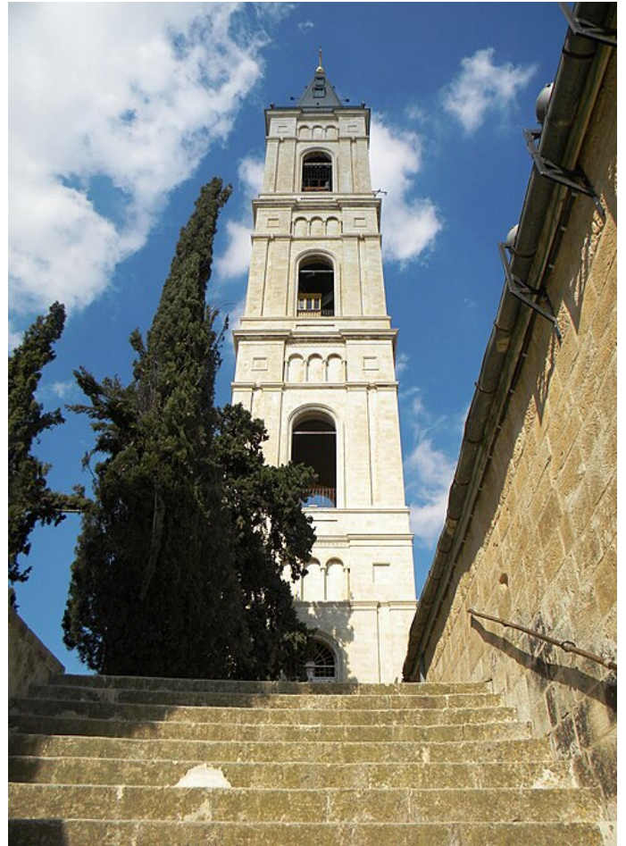
Колокольня Русской Православной Церкви, Вознесенский Монастырь