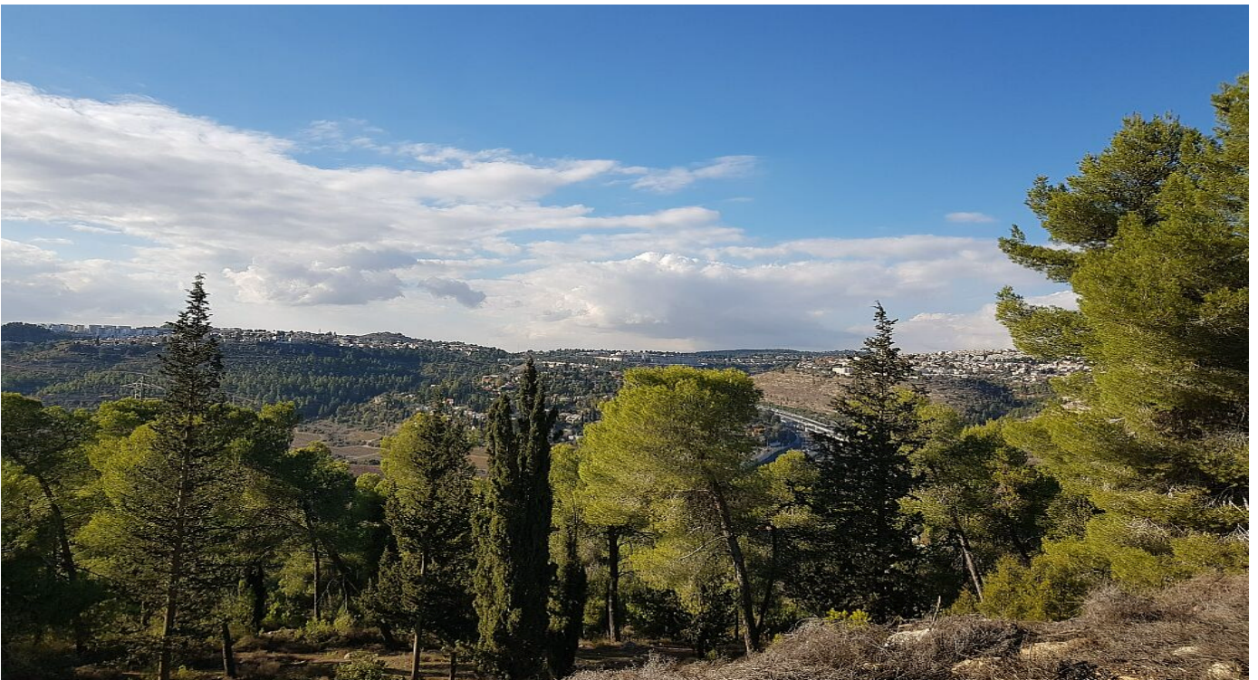
Иерусалимский лес (05.12.24)