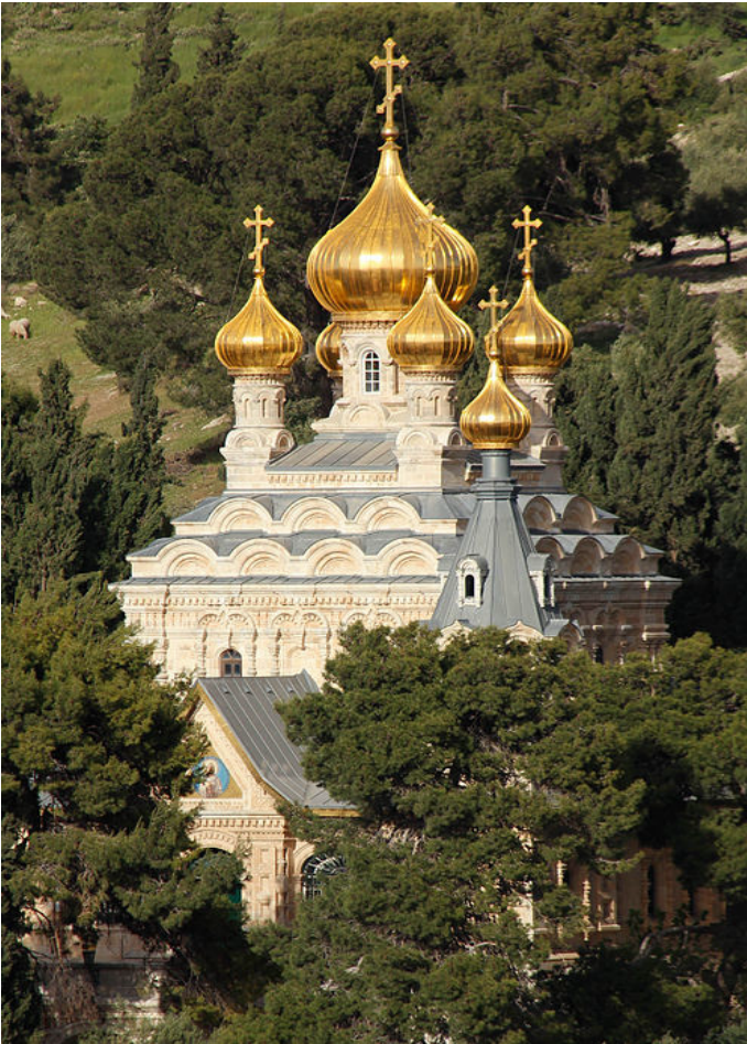
Русская Православная Церковь Святой Марии Магdalины