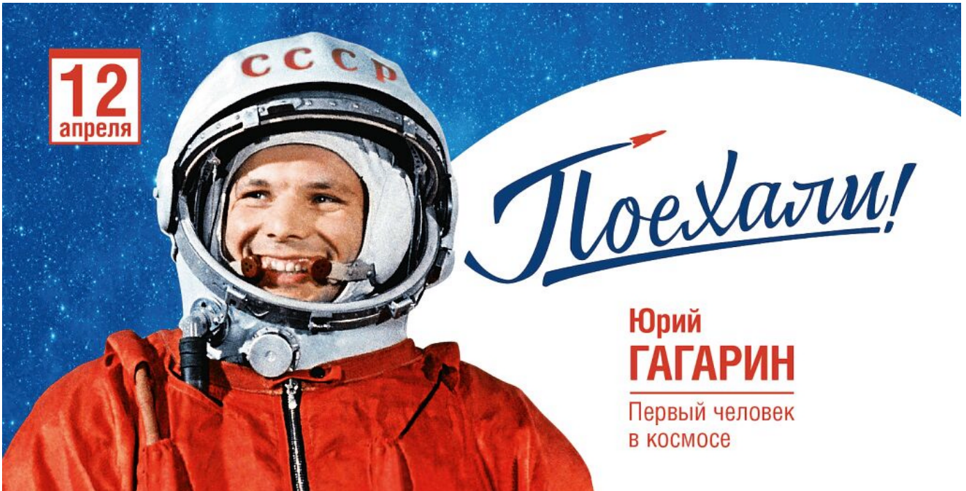
12 Апреля 1961г. Гагарин открыл космическую эпоху в истории планеты Земля, а мы дрочим на тупофоны и на искусственный дибиллект.